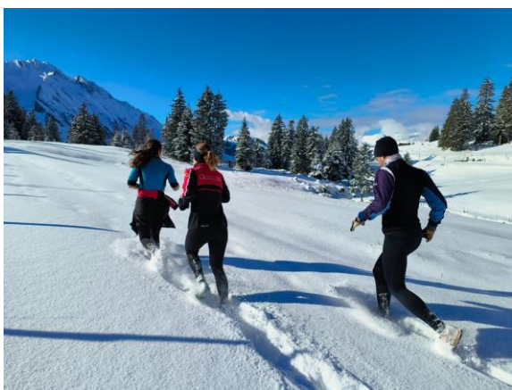
Kazu über dem Nebel Sörenberg (November)