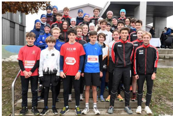
Steinhölzlilauflauf - Eltern/PB-Event Bern (Dezember)