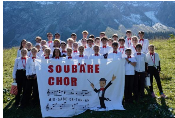
Jugendcup Plaffeien/Schwarzsee (September)