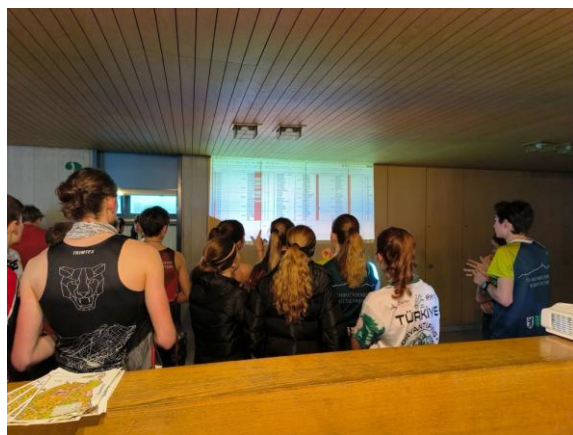
Kazu 2 Stäfa (Februar)