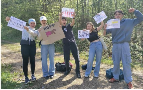
Testläufe Hoch-Ybrig/Stoos (Mai)