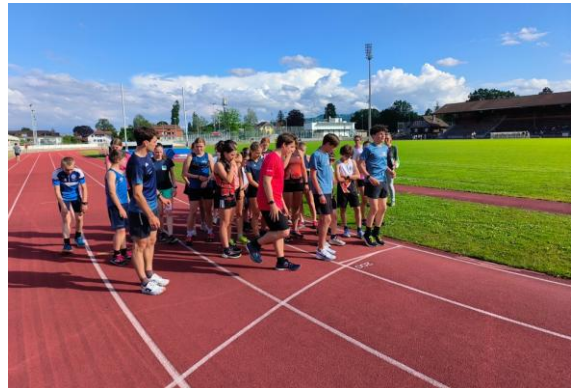
3000m Tests (März/Juni/September)