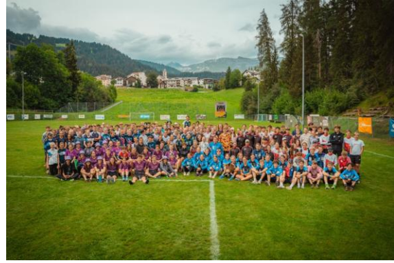
Jugendlager Flims/Laax (Juli)