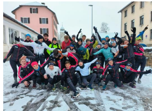
Kazu über dem Nebel La Chaux-du-Millieu (Dez)