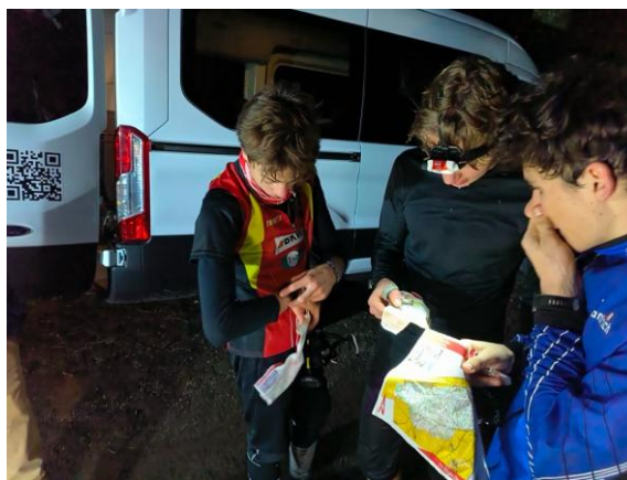
Kazu 3 Wyssachen (März)