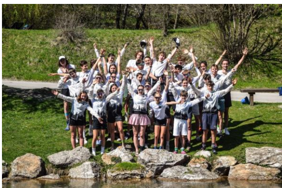
Trainingslager Kroatien (April)