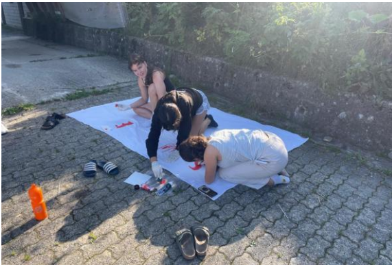
Jugendcup-Vorbereitung Gantrisch (August)