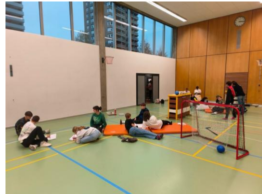
Kazu Auswertung Olten (November)