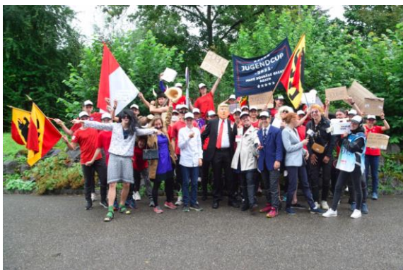
Jugendcup Andelfingen (August)