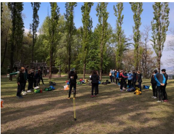
Trainingslager Tessin (April)