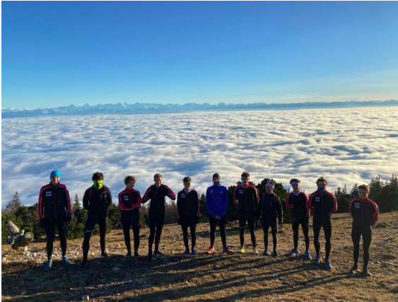
Kazu über dem Nebel online/in Gruppen (November)