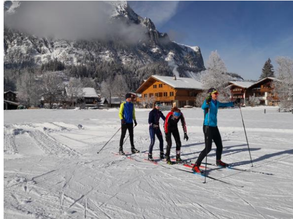
Kazu 1 Kandersteg (Januar)