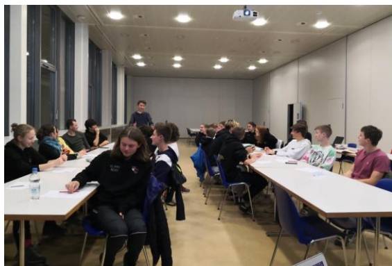
Kazu Auswertung Willisau (Oktober)