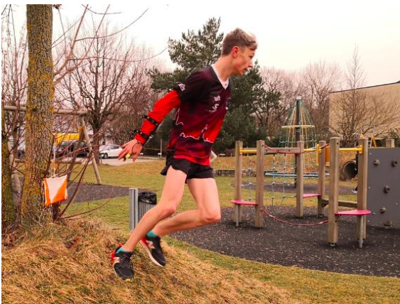
Kazu 2 Rubigen/Münsingen/Olten (Februar)