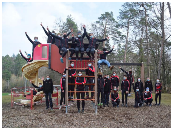
Kazu 3 Neuenburger Jura (März)