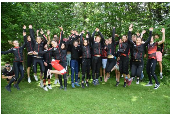
Trainingslager Wallis (Juli)